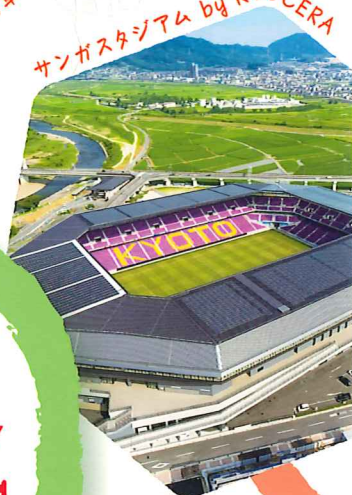
サンガスタジアム by KYOCERA