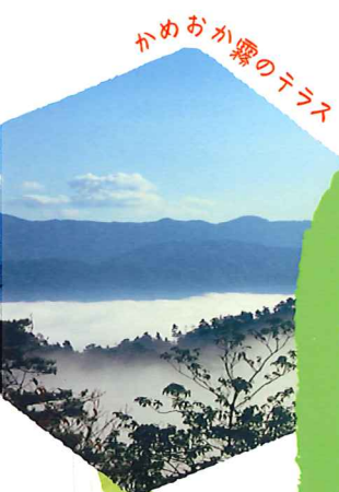
かめおか霧のテラス