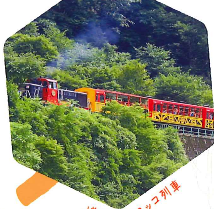
嵯峨野トロッコ列車

10月～12月の期間中に亀岡市内で トロッコ列車、保津川下りの特別便、デジタルスタンプラリー、 eスポーツイベント、ナイトタイムイベントなどを開催 開催場所や日時など詳細は公式サイトへ