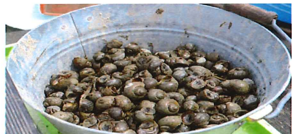
手作業で捕獲したタニシ