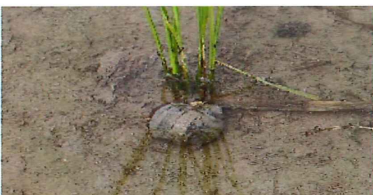
苗を食べています

変化といえば、してほしくない変化の話を知りました。「ジャンボタニシ」が田植えの終わった水田に派生し、苗を食べてしまうとのこと。生活様式がグローバルになってきたマイナス面だと思います。天敵のいない外来種は我がもの顔に増えていきます。手で駆除するしか仕方がないと言われていました。